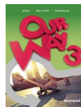
Inglês Our Way – volume 3 - Edição Premium Editora: Richmond