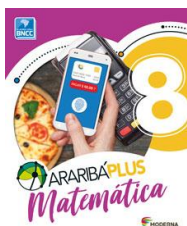
Matemática – 8º ano - Araribá Plus– 5ª edição Editora: Moderna