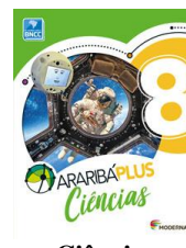
Ciências Araribá Plus - 8º ano– 5ª edição Editora Moderna