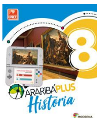
História – 8º Ano - Araribá Plus– 5ª edição Editora: Moderna