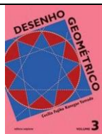
Desenho Geométrico Desenho Geométrico – Volume 3 Autora: Cecília Fujiko Kanegae Editora Scipione - 2ª Edição

Livro de Desenho Geométrico é da Editora Scipione e não é vendido junto ao site. Somente este deve ser adquirido separadamente.