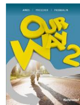
Inglês Our Way – volume 2 - Edição Premium Editora: Richmond