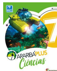
Ciências Araribá Plus - 7º ano– 5ª edição Editora Moderna