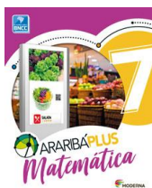
Matemática – 7º ano Araribá Plus– 5ª edição Editora: Moderna