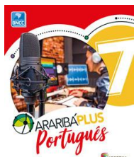
Português – 7º Ano - Araribá Plus– 5ª edição Editora: Moderna