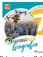
Geografia – 7º Ano - Araribá Plus– 5ª edição Editora: Moderna