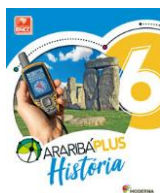
História – 6º Ano - Araribá Plus – 5ª edição Editora: Moderna