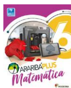
Matemática - 6º Ano - Araribá Plus – 5ª edição Editora: Moderna