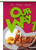
Inglês Our Way – volume 1 - 8ª Edição Editora: Richmond