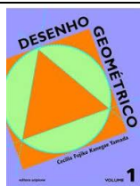
Desenho Geométrico Desenho Geométrico – Volume 1 Autora: Cecília Fujiko Kanegae – Editora Scipione - 2ª Edição

O livro de Desenho Geométrico é da Editora Scipione e não é vendido junto ao site. Somente este deve ser adquirido separadamente.