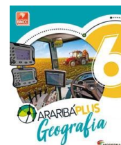
Geografia – 6º Ano - Araribá Plus – 5ª edição Editora: Moderna