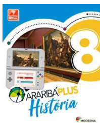
História – 8º Ano - Araribá Plus– 5ª edição Editora: Moderna