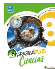
Ciências Araribá Plus - 8º ano– 5ª edição Editora Moderna