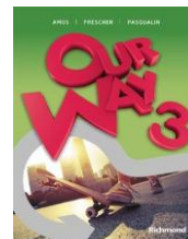
Inglês Our Way – volume 3 - Edição Premium Editora: Richmond