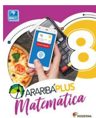
Matemática – 8º ano - Araribá Plus– 5ª edição Editora: Moderna