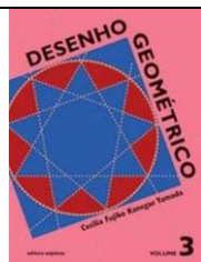
Desenho Geométrico Desenho Geométrico – Volume 3 Autora: Cecília Fujiko Kanegae Editora Scipione - 2ª Edição

Livro de Desenho Geométrico é da Editora Scipione e não é vendido junto ao site. Somente este deve ser adquirido separadamente.